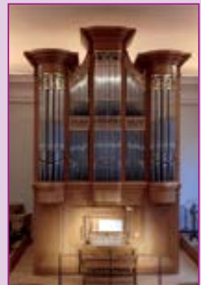
Die Weimbs-Orgel in der Annakirche

Werke von Bach, Rinck und italienischen Komponisten; Ute Gremmel-Geuchen – Orgel