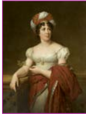
Germaine de Staël, Porträt von Marie Éléonore Godefroid nach François Gérard (1813)