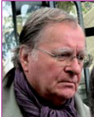
Mit dem niederländischen Theologen Huub Oosterhuis auf dem „Weg nach Nizäa“

30. Juni , Angela Reinders, Bischöfliche Akademie, Prompting God