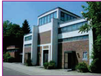
In St. Bonifatius finden u.a. auch koptische Gottesdienste statt.

Die koptisch-orthodoxe Kirche beispielsweise feiert am Samstag in St. Bonifatius in Forst. Rund 200 Mitglieder zählt die Gemeinde, deren Ursprung in Ägypten liegt und deren apostolische Tradition auf das 1. Jahrhundert zurückgeht. Man schätzt, dass dort etwa 10