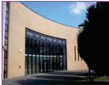
Die Jüdische Synagoge in Aachen

Jahrzehnten in der Aachener Region weiter, die christlichen Kirchen definierten ihr Verhältnis zum Judentum neu, weg von einer Theologie der Verachtung hin zur Entdeckung der gemeinsamen Wurzeln. Und gemeinsam setzten sich Juden und Christen vor Ort gegen antisemitische Bestrebungen ein. „In gewisser Weise waren die neunziger Jahre ein Höhepunkt in der Arbeit der Gesellschaft. Tatkräftig und mit der Einstellung von spezialisiertem Personal unterstützte sie die Stadt Aachen beim großen Projekt der