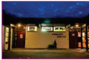
Die Weihnachtsfenster in der Emmaus-Kirche im Jahr 2022

Auch in diesem Jahr finden in einigen Gemeindebereichen in Aachen wieder „Adventsfenster“ statt. Vor allem rund um Auferstehungs- und I m m a n u e l -