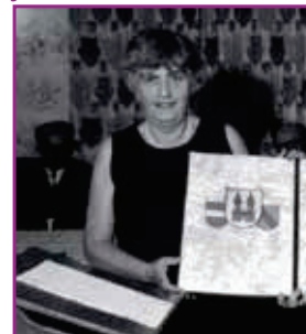
Marie Luise Kaschnitz im Jahr 1967

„Leicht wie der Geist der Rose“ - ein literarisches Portrait am Vorabend zum 125. Geburtstag von Marie Luise Kaschnitz (1901-1974) am Freitag, 30. Januar, um 18.30 Uhr in der Immanuelkirche.