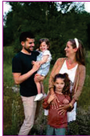
Das SoFIA-Projekt in Alsdorf begleitet Familien

Manchmal braucht es jemanden, der mitgeht. Der zuhört, wenn Sorgen groß werden. Der Orientierung gibt, wenn Wege sich verändern. Genau das tut SoFIA - Starke Familien in Alsdorf: Das Projekt des Diakonischen Werks im Kirchenkreis Aachen begleitet Mütter, Väter und Kinder durch den Alltag und in besonderen Lebensphasen.