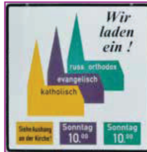
Hinweise auf Gottesdienste verschiedener Konfessionen in Bischofsheim

Warum gibt es verschiedene christliche Konfessionen? Was verbindet sie und wo verlaufen die Unterschiede? Was bedeutet das für das Verständnis von Kirche? Und vor allem: Wie kann echte Gemeinschaft im Glauben in Vielfalt gelingen? Kirche und Kirchen, das Selbstverständnis der Konfessionen und die Frage der Ökumene – darum geht es an diesem Abend