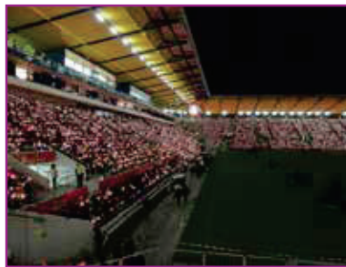
Festliche Weihnachtsstimmung beim Tivoli-Weihnachtssingen

Veranstaltet wird es von der „Arbeitsgemeinschaft christlicher Kirchen“ (ACK) in Aachen. Es ist also inzwischen zu einer kleinen Tradition geworden. Eine ganz besondere Stimmung verbreitet sich, wenn 25.000 Menschen gleichzei-