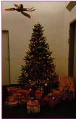
Alljährlich findet die Spendenaktion des Betreuungsvereins statt.

Der Betreuungsverein der Diakonie Aachen e.V. begleitet Menschen mit psychischen Erkrankungen, geistigen oder körperlichen Beeinträchtigungen sowie Menschen mit Hörbehinderung – und damit auch ihre Familien. Besonders zur Weihnachtszeit liegt dem Verein eine etablierte Tradition am Herzen: Die jährliche Weihnachtsaktion für Kinder.