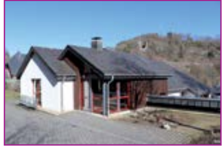
Im Jugendgästehaus Monschau findet die diesjährige Sommerfreizeit der JuKi statt

Wer die JuKi vorab schon einmal kennen lernen möchte, findet Informationen auf Instagram unter @juki_ac oder auf der Webseite www.juki-aachen.de . Darüber hinaus gibt es in den Osterferien vom