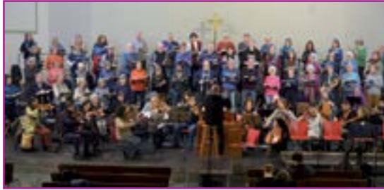
Die Kantorei Aachen

Die „Kantorei an der Auferstehungskirche“ wird am 22. November mit Solisten und Orchester das Oratorium „Die letzten Dinge“ von Louis Spohr aufführen. Dazu werden noch interessierte Sängerinnen und vor allem Sänger