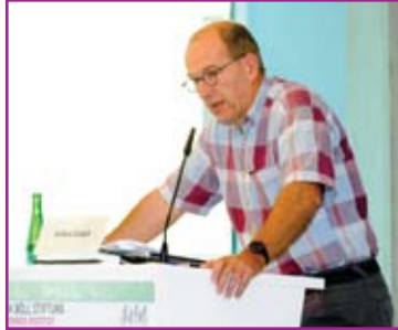
Andreas Zumach im Jahr 2010

und Vertrauen noch eine Chance oder müssen wir uns dauerhaft auf Konfrontation und einen neuen Kalten Krieg einstellen, welcher jederzeit in eine kriegerische Auseinandersetzung münden kann?