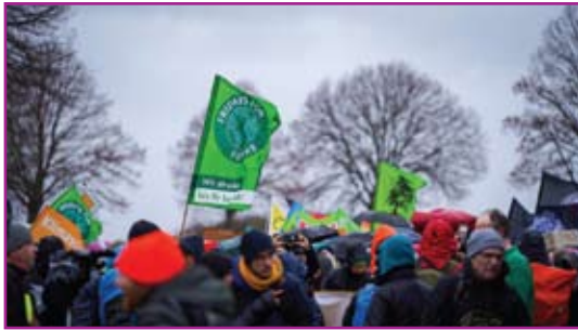
Demonstration gegen die Räumung von Lützerath

Über die Proteste um die Räumung des kleinen Dorfes in der Aachener Region wurde weltweit berichtet. Über die Notwendigkeit bezahlbarer Strompreise und „nationaler Energiesouveränität“ kontra Kohleverstromung geht es in der Podiumsdiskussion am Mittwoch, 15.3., um 18 Uhr im