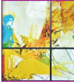
Das Glasfenster in der Immanuelkirche

Im Dezember wurde in der Immanuelkirche das neue Altarfenster eingebaut. Der Stuttgarter Glaskünstler Lukas Derow hat die Begegnung Mose mit Gott im brennenden Dornbusch dargestellt. Dies gibt Anlass für eine Vortragsreihe in der Immanuelkirche, die sich mit der Gestalt des Mose in der Bibel und seiner Darstellung in der Kunstgeschichte und der Glasmalerei beschäftigt.