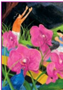
Das Titelmotiv der jungen taiwanischen Künstlerin Hui-Wen Hsiao

Das Weltgebetstags-Komitee zitiert aus dem Brief des Apostels Paulus an die christliche Gemeinde in Ephesus: „Jeden Tag danke ich Gott dafür, dass es euch gibt;