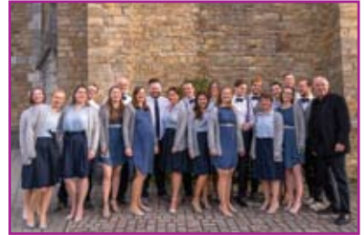
Der chor cantiamo aachen

Durch seine erfolgreiche Finalteilnahme am WDR-Wettbewerb „Der beste Chor im Westen“ 2019 ist chor cantiamo aachen einer breiten Öffentlichkeit „kurz vor Corona“ bekannt geworden. Der Eintritt ist frei, Spenden zur Kostendeckung sind erbeten.