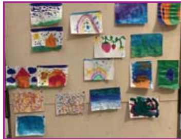
Aktiv und kreativ sein bei „Kirche kunterbunt“

Ein Erklär-Video gibt es hier: http://tinyurl.com/mry97wf2