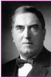
Maurice Durufly 1962

Auch die Messe des Requiem seines früh verstorbenen Zeitgenossen Jehan Alain lässt in die modal geprägte, ungemein farbenreiche Harmonik der französischen Kirchenmusik eintauchen. Karten gibt es ab 3. Februar.