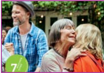
Das Titelmotiv der diesjährigen Fastenaktion „7 Wochen Ohne“

In den Fastenwochen zwischen Aschermittwoch und Ostern lädt „7 Wochen Ohne“ – die Fastenaktion der evangelischen Kirche – seit 1983 Menschen aller Altersgruppen ein, innezuhalten und den Blick auf den Alltag zu verändern: für sich allein, in Familien oder als