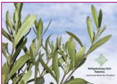
Das neue Motiv des WGT zum 1. März: ein Olivenzweig