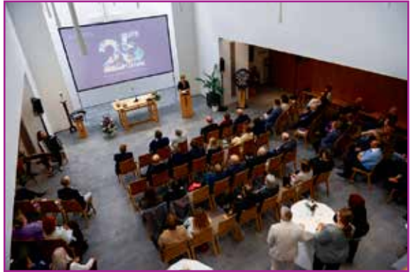
Mit einem Festakt in der Genezareth-Kirche feierte die Diakonie Aachen ihr 25-jähriges Jubiläum