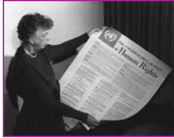
Eleanor Roosevelt hält 1949 ein Poster der Menschenrechtserklärung in den Händen.

Menschenrechte und das Völkerrecht bilden zentrale Grundlagen für den Schutz der Würde und Freiheit jedes Einzelnen sowie für das friedliche Zusammenleben von Staaten. Während Menschenrechte uni-