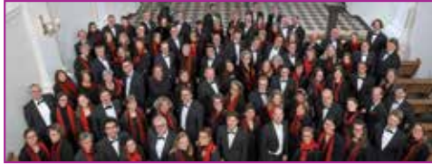
Der Aachener Bachverein gastiert am 13. Juni in der Thomaskirche in Leipzig

Das 1908 ins Leben gerufene Bachfest Leipzig zählt mittlerweile zu den bedeutendsten internationalen Musikfestivals. Mit Umfang und Qualität seines Programms sowie der Authentizität seiner Orte, nämlich der historischen Wirkungsstätten Bachs,