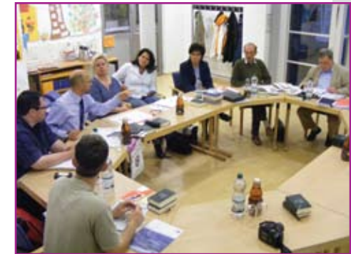
Sitzung des Bereichs-presbyteriums Mitte

Die Aufgaben des Presbyteriums, in dem neben den gewählten Presbytern auch Pfarrer und (gewählte) Mitarbeitende der Kirchengemeinde Mitglied sind, sind vielfältig: Es bestimmt über Personalangelegenheiten, über Gottes-