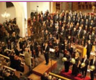
Der Aachener Bachverein